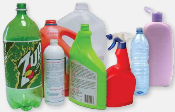
ALL PLASTIC BOTTLES

REDUCE FIRST, THEN REUSE, AND LASTLY RECYCLE. All items should be clean, dry, and loose (not bagged). Bottles should be rinsed out and emptied. Break down boxes. Empty aerosol cans. NO LIQUIDS - NO PLASTIC BAGS