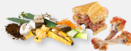
RESTOS DE COMIDA Y SOBRAS

Reduzca el desperdicio priorizando materiales reutilizables y duraderos en vez de los de un solo uso. Comida y papel mojado/sucio en la basura serán separados y convertidos en compost en el ReSource Center del Condado. NO ELECTRÓNICOS - NO RESIDUOS PELIGROSOS