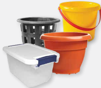
RIGID PLASTICS GREATER THAN 6"