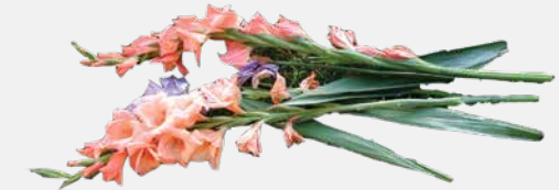
FLOWERS & PLANTS