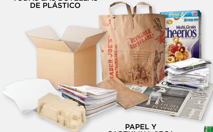
PAPEL Y CARTULINA SECA