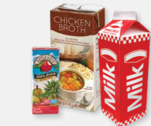
CARTONS & WAXED CARDBOARD