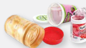
PLASTIC FOOD CONTAINERS