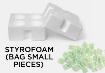
STYROFOAM (BAG SMALL PIECES)