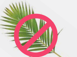
NO HOJAS DE PALMAS