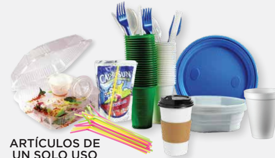
ARTÍCULOS DE UN SOLO USO