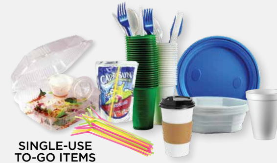
SINGLE-USE TO-GO ITEMS