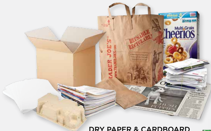
DRY PAPER & CARDBOARD