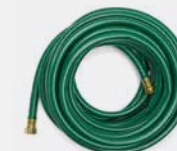
MANGUERA DE JARDÍN