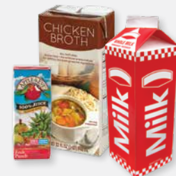
CARTONES Y CARTULINA ENCERADAS