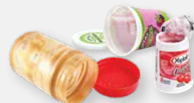
CONTENEDORES PLÁSTICOS PARA ALIMENTOS