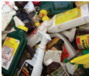
QUÍMICOS DE JARDINERÍA