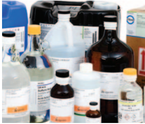
QUÍMICOS DE LABORATORIO