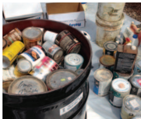
TINTES Y SOLVENTES