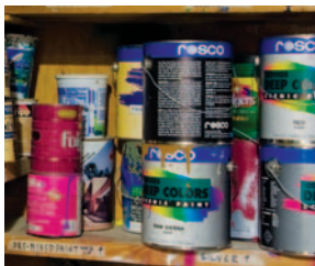
PRODUCTOS DE PINTURA