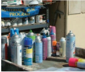
AEROSOL Y ADHESIVOS

Estos son algunos de los artículos aceptados en el Centro Comunitario de Recolección de Residuos Peligrosos. Consulte la lista de Tarifas de Eliminación para las Empresas.