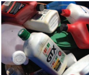
LÍQUIDOS DE AUTOMÓVIL